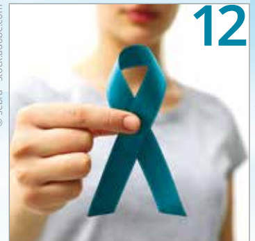
Update Krebs – Zahlen und Daten