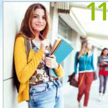
Welches Studium passt zu mir?